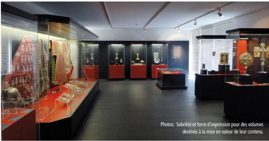
Photos: Sobriété et force d'expression pour des volumes destinés à la mise en valeur de leur contenu.